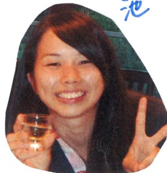
毎日 ハイテンション! 池