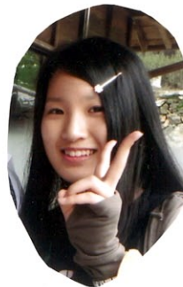
ミルクティーと すき焼きは + スコンビ ネーション!