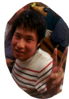
人間 + ビゲーション 北岡